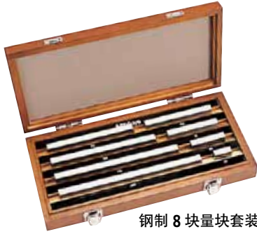
钢制 8 块量块套装