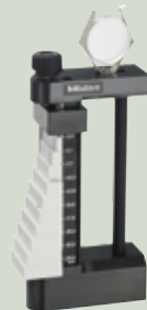
(量块和平行平晶为选件)