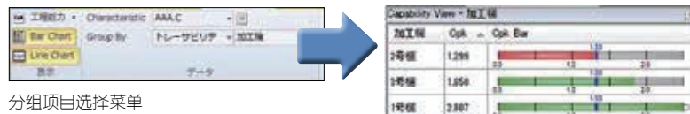
分组项目选择菜单